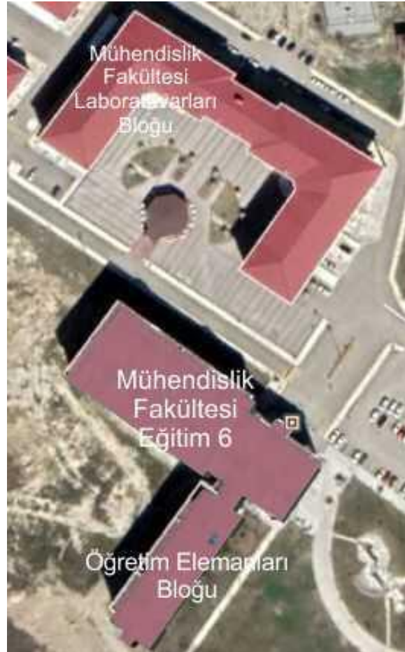
Şekil 7. Mühendislik Fakültesi ve laboratuvar bina planı (Google Earth ile oluşturulmuştur)

Harita Mühendisliği Anabilim Dalı, Mühendislik Fakültesi içinde toplam kapalı alanı yaklaşık 3000 m olan Mühendislik Fakültesi (Eğitim 6 Binası) ve toplam kapalı alanı yaklaşık 2100 m olan Mühendislik Fakültesi Laboratuvar binasında yer almaktadır. Mühendislik Fakültesi binasında; sınıflar, öğrenci çalışma alanları, kulüp etkinliklerinin sürdürüldüğü sınıflar ve konferans salonu yer almaktadır. Mühendislik Fakültesi Laboratuvar binasında ise laboratuvar ve öğrenci çalışma alanları yer almaktadır. Mühendislik Fakültesi binasındaki kullanım alanları aşağıdaki şekilde (Şekil 7) görülmektedir.