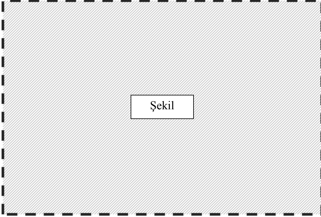
Şekil 3.1 Şekil başlıklarının yazımında 1 satır aralığı ve 11 Punto kullanılmalı ve bunlar iki yana yaslı olacak şekilde biçimlendirilmelidir.